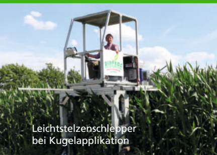
Leichtstelzenschlepper bei Kugelapplikation