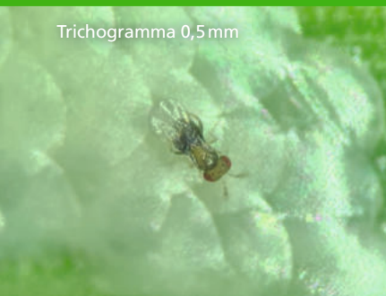
Trichogramma 0,5 mm