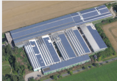
BIOCARE Betriebsgelände von oben